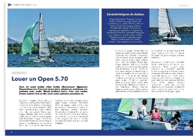
Revue annuelle du YCG 2022

Annuaire des membres : diffusion numérique aux membres + en téléchargement sur le site du club. Sortie prévue en avril 2022.